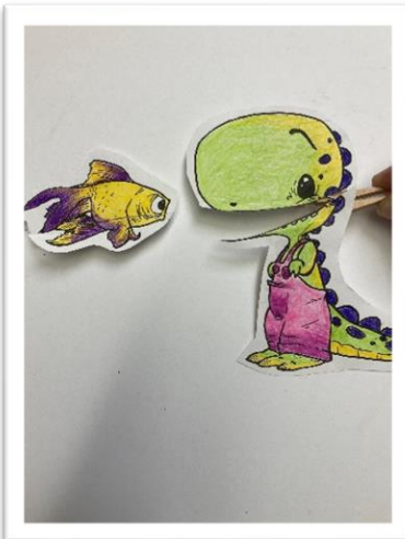
ከእርስዎ መጨመሪያዎች ጋር ይጨምሩ! ታሪኩን ለታናሽ ወንድምዎ ወይም ለእህትዎ ይጎገሩ። ዳይፕሰርዎ ምን ይመስለዎት?