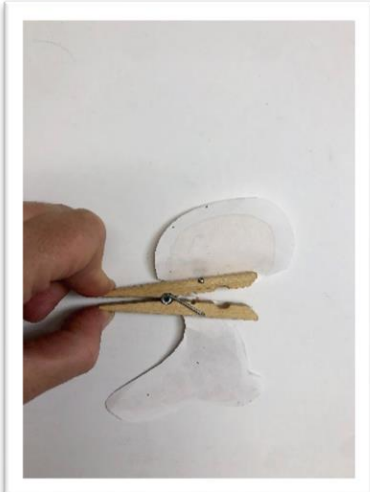
ከእንጨት መቆንጠጫው የላይኛው ግማሽ የባህሪው የላይኛው ክፍል ሙጫ ያድርጉ። የታችኛውን ግማሹን ወደ ላይ ያዘምዱት እና ከዚያ የታችኛውን ግማሽ ወደ ታችኛው የእንጨት ቅንጥብ ያያይዙት።